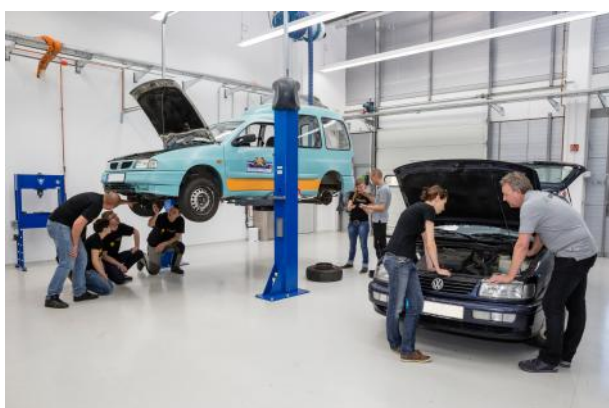
En amont du rallye Allgäu-Orient (AOR): Contrôle des véhicules chez Schaeffler Automotive Aftermarket.

Avec ce Rallye, Schaeffler démontre encore une fois ses capacités à équiper et à s'adapter à tous les segments de véhicules. Être à la fois à la pointe de la technologie sur les automobiles modernes tout en restant extrêmement performant sur le segment des véhicules de plus de 20 ans.